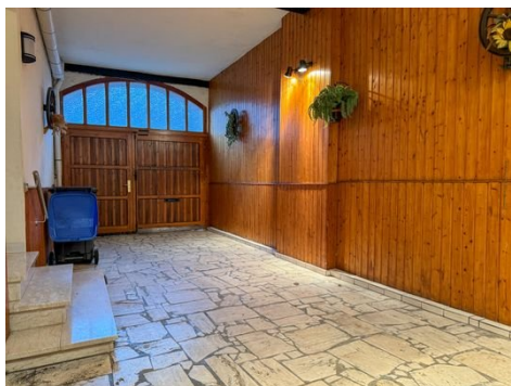
Toreinfahrt / PKW-Stellplatz